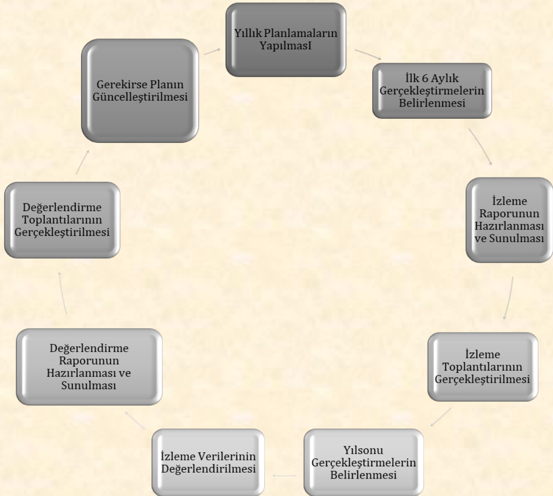
Şekil 1: İzleme ve değerlendirme süreci

Performans göstergeleri aracılığıyla amaç ve hedeflerin gerçekleşme sonuçlarının belirli bir sıklıkla izlenmesi ve belirlenen dönemler itibarıyla raporlanarak yöneticilerin değerlendirilmesine sunulması izleme faaliyetimizi oluşturacaktır.